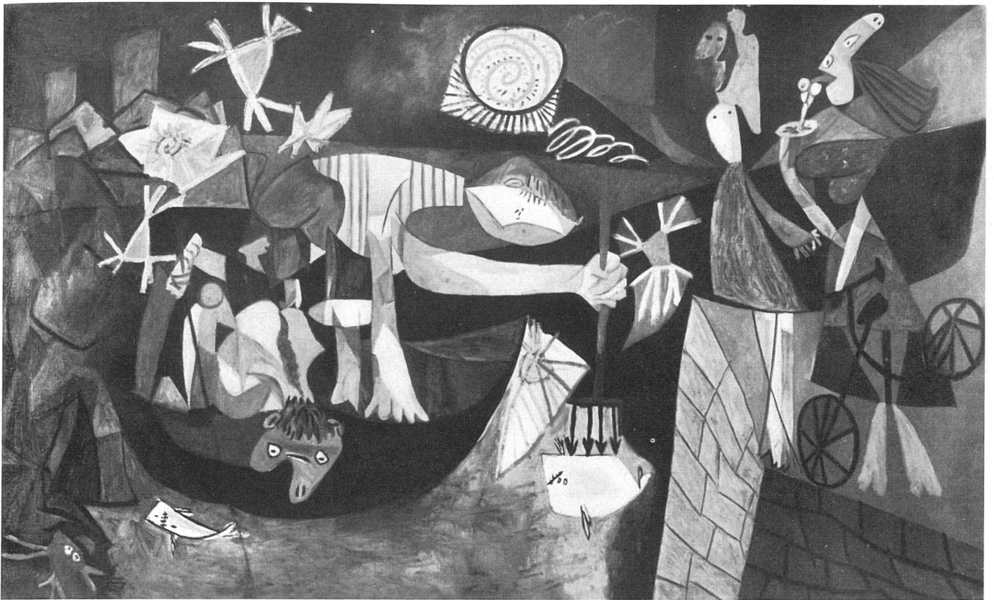
Pablo Picasso, Nächtlicher Fischfang in Antibes, August 1939 | La pêche nocturne à Antibes | Night Fishing at Antibes . The Museum of Modern Art, New York. Mrs. Simon Guggenheim Fund

ringsten zu verachten, nicht nur an die materielle Hilfe. Ohne geistige Hilfe, ohne geistiges Einverständnis wäre das eigene Tun ein unfruchtbarer Monolog. Das Schönste aber, was einer Museumstätigkeit wiederfahren kann, ist der geistige Dialog mit materiellen Konsequenzen. Und wie viel Zufall und wie viel Glück ist beim Wachstum eines Museums im Spiel. Glück vor allem!