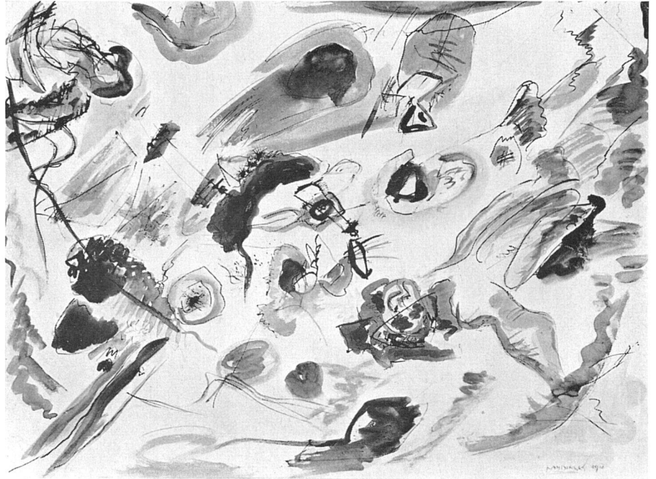
Wassily Kandinsky, Erstes abstraktes Aquarell, 1910 | Première aquarelle abstraite. 1910 | First abstract watercolour, 1910