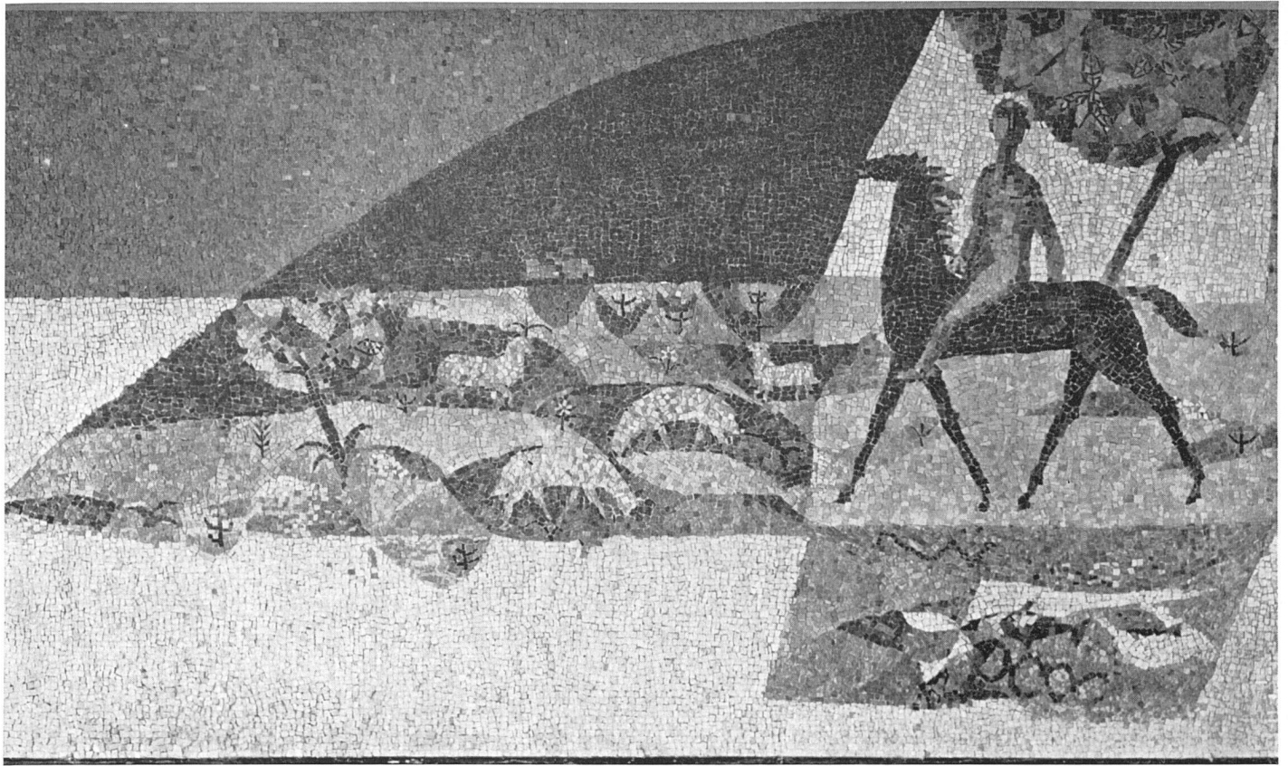
Emanuel Jacob, Mittelteil des Mosaïks / Partie centrale de la mosaïque / Middle section of the mosaic