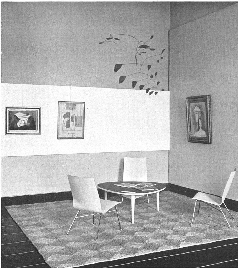
Sitzgruppe. Bilder: Juan Gris, Pablo Picasso. Mobile: Alexander Calder. Möbel: Sperrholzstuhl der Wohnhilfe Zürich, Entwurf: A. Rauch, St.Gallen; Tisch der Wohnbedarf AG., Zürich und Basel, Entwurf: Max Bill SWB, Zürich und Ulm | Ensemble de sièges; tableaux de Juan Gris, Pablo Picasso; mobiles d'Alexander Calder | Seating arrangement with pictures by Juan Gris and Pablo Picasso, and mobile by Alexander Calder

verhängten Fenstern und einer Schale für die Visitenkarten mit den Tauben, oder die Eßzimmer mit Buffet und Früchtestilleben oder die Wohnzimmer mit sechs Nußbaumstühlen und einem verschlossenen Bücher-schrank? (Außerdem gab es im Souterrain noch ein Zimmer im Heimatstil.)