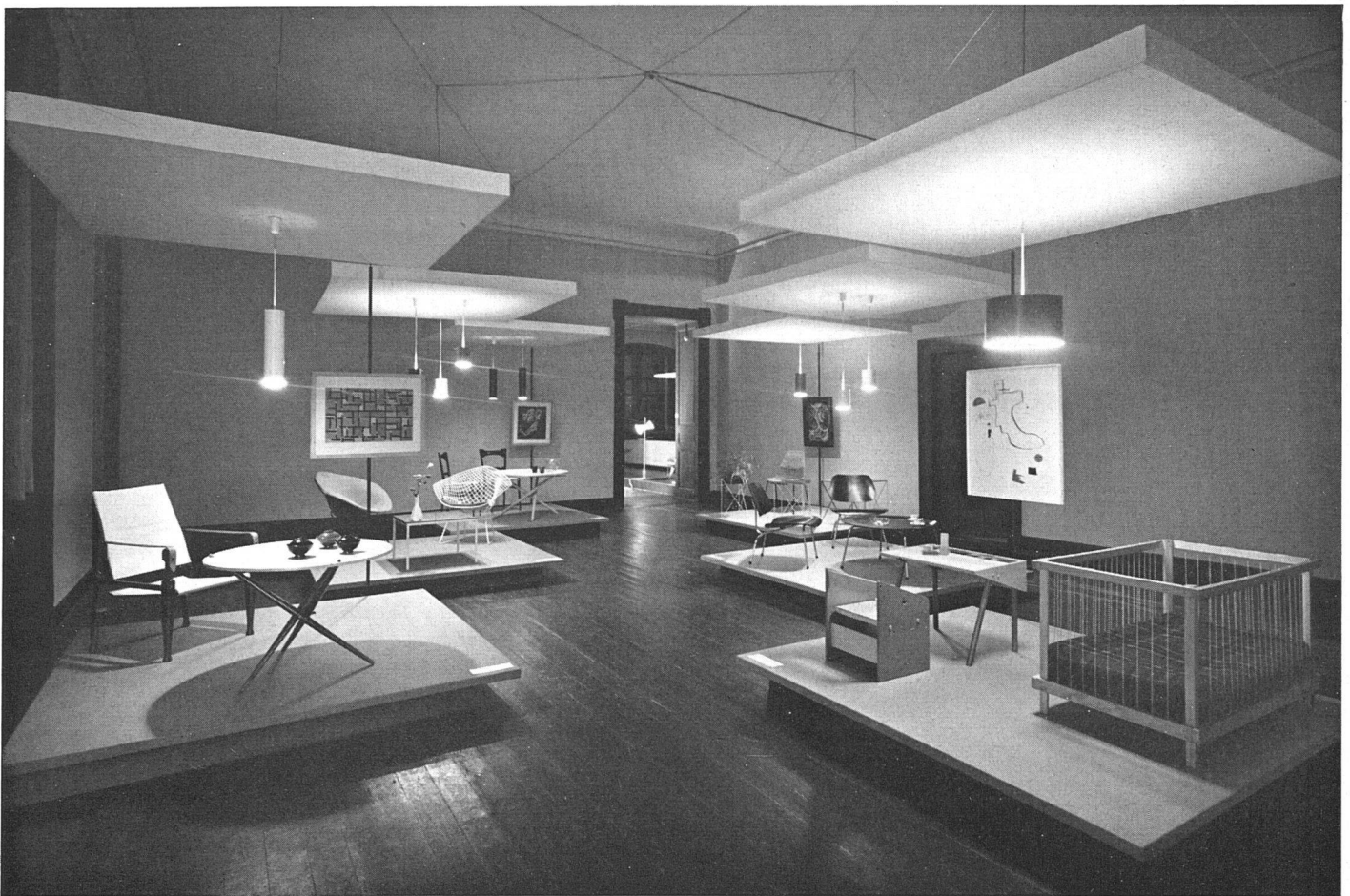
Blick in die Ausstellung «Das Bild im Wohnraum unserer Zeit» im Kunstmuseum St. Gallen. Gestaltung: Reni Trüdinger, Innenarchitektin, Sankt Gallen und Zürich. Bilder: Theo van Doesburg, Wassily Kandinsky, Francis Picabia, Joan Miró. Möbel: Wohnbedarf AG., Zürich und Basel; Wohnhilfe, Zürich; Jürg Bally, Zürich; Willi Guhl SWB, Zürich; Walter Kilchenmann, Bern; Godhard von Heydebrand SWB, Bern. Beleuchtung: Lenzlinger & Schaerer, Zürich | L'exposition «Le tableau dans l'habitation contemporaine», Musée des Beaux-Arts de St-Gall. Présentation: Reni Trüdinger, ensemblière, St-Gall et Zurich | Exhibition 'The Picture in the Modern Interior', Kunstmuseum, St. Gallen. Arrangement: Reni Trüdinger, Interior Decorator, St. Gallen and Zürich