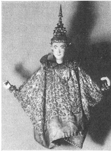
Marionette aus Siam. Völkerkundemuseum Zürich