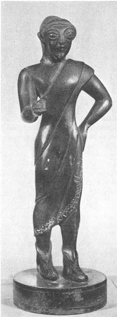
Opfernder aus Elba. Kleinbronze, 4. Viertel 6. Jahrhundert. Neapel

Jahrzehnte offenbar so selbstverständlich geschahen, daß man gar nicht daran dachte, auch die näheren Lebens- und Arbeitsumstände der Keramiker in Erfahrung zu bringen und aufzuzeichnen. Nicht nur das Kunstgewerbemuseum versäumte die Aufzeichnungen der Personalien, auch die in letzter Zeit konsultierten Lexika und Handbücher schweigen. Vielleicht bietet sich hier eine neue, wie es scheint, dringende wissenschaftliche Aufgabe für die kürzlich gegründete schweizerische Ceramica-Gesellschaft? m. n.