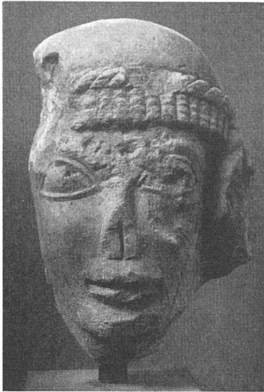
Fragment eines Kopfes aus Chiusi. Stein, 3. Viertel 6. Jahrhundert. Chiusi

die Geschichte und Erforschung des modernen Kunstgewerbes auch wieder interessante Tatsache, daß die Ankäufe der Keramiken im Laufe der