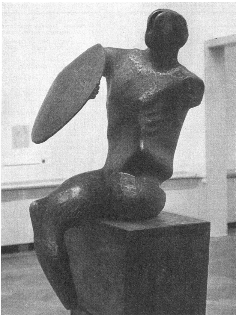
Henry Moore, Krieger mit Schild, 1953/54. Bronze. Neuerwerbung des Kunstmuseums Basel

des «Naïfs». Avec une feinte maladresse et un sens très sûr des charmes de son imagination, il campe des personnages barbues et surannés au milieu de jardins précis et un peu mystérieux, il édifie des châteaux hantés sur des rochers de carton-pâte, il fait grimacer des bûcherons inquiétants sortis tout droit d'une vieille légende germanique. Toutes ces fables ne manquent pas de séduction, mais cette séduction doit peu, somme toute, à l'art de peindre proprement dit.