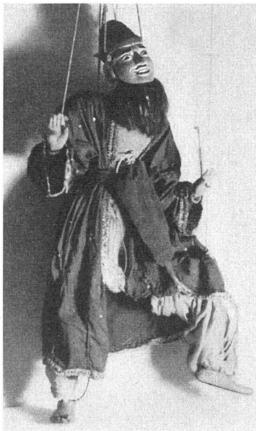
Marionette aus Burma

in fremde Räume. In dieser Situation des Ausgeschlossenen sind Bilder entstanden, die voll Zartheit und Poesie sind. Nicht etwa daß es hier inhaltlich um große Dinge ginge – es geht um die kleinen Alltäglichkeiten und um letzte Gemeinschaft und letzte Einsamkeit des Alltags, in der die formalen Probleme zu sekundären Fragen, zu eigentlichen Schattenbildern reduziert werden.