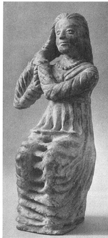
Sich kämmendes Mädchen. Ton, späthellenistisch. Florenz

Verschiedene Strömungen sind in die Kollektion einbezogen. Trotzdem war der Gesamteindruck, den die Ausstellung vermittelte, eher monoton, ob-