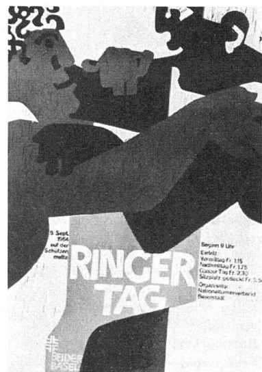
Entwerfer: Jürg Schaub, Basel

würde man zum Beispiel einen Gegenstand beurteilen, dessen Konstruktion zwar eindeutig in Metall gedacht ist, der jedoch aus Holz fabriziert wird?