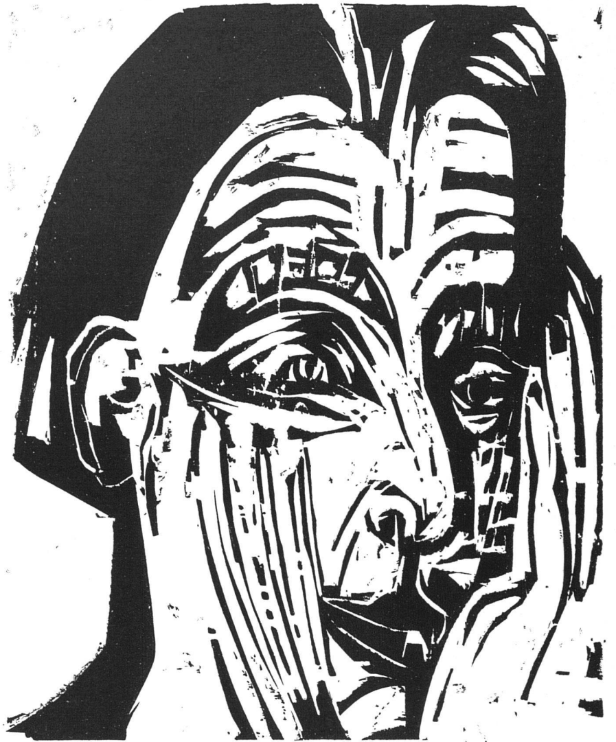
Albert Müller, Bildnis Ernst Ludwig Kirchners, 1926. Holzschnitt | Portrait d'Ernst Ludwig Kirchner. Bois | Portrait of Ernst Ludwig Kirchner. Woodcut

aquarell «Spielende kinder» spielt die liebe zum ornament den verführer, besonders in dem unteren kinderkopf, siehe augen und nase und verbindung des kopfes mit dem boden durch die kugeln. wie fein ist dagegen die radirung «Frauenkopf». Sehr seltsam wirkt auch das bild «Monte Generoso Culm», welche geschlossenheit der formen schwere der felsen. Der «Garten» wirkt geschickt dagegen.