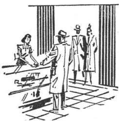
Verkaufsräume Magasins de vente

Les portes coulissantes MODERNFOLD offrent plus que la solution appropriée du problème de la fermeture et des séparations secondaires. Par leur aspect élégant et surtout décoratif, elles confèrent à ce qui les entoure un certain cachet et elles s'adaptent harmonieusement à la décoration intérieure moderne. Leur sobre élégance et leur maniement facile, le fonctionnement impeccable de ces «cloisons mouvantes» leur repli régulier en n'importe quelle position, sont la raison pour laquelle les architectes et les constructeurs donnent de plus en plus la préférence aux portes coulissantes MODERNFOLD. Elles ne nécessitent aucun rail au plancher, elles peuvent se mouvoir en cercle, offrant ainsi les plus grandes possibilités d'aménagement et d'économie d'espace. La plus grande cloison pliante que nous avons exécutée jusqu'à présent a 22 m de large et 6 m de haut, elle est aménagée en double S et commandée par moteur électrique.