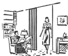
Ihr Heim Votre home