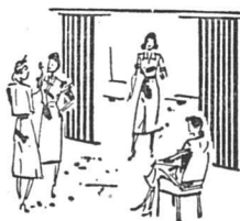
Aufenthaltsräume Salles de séjour