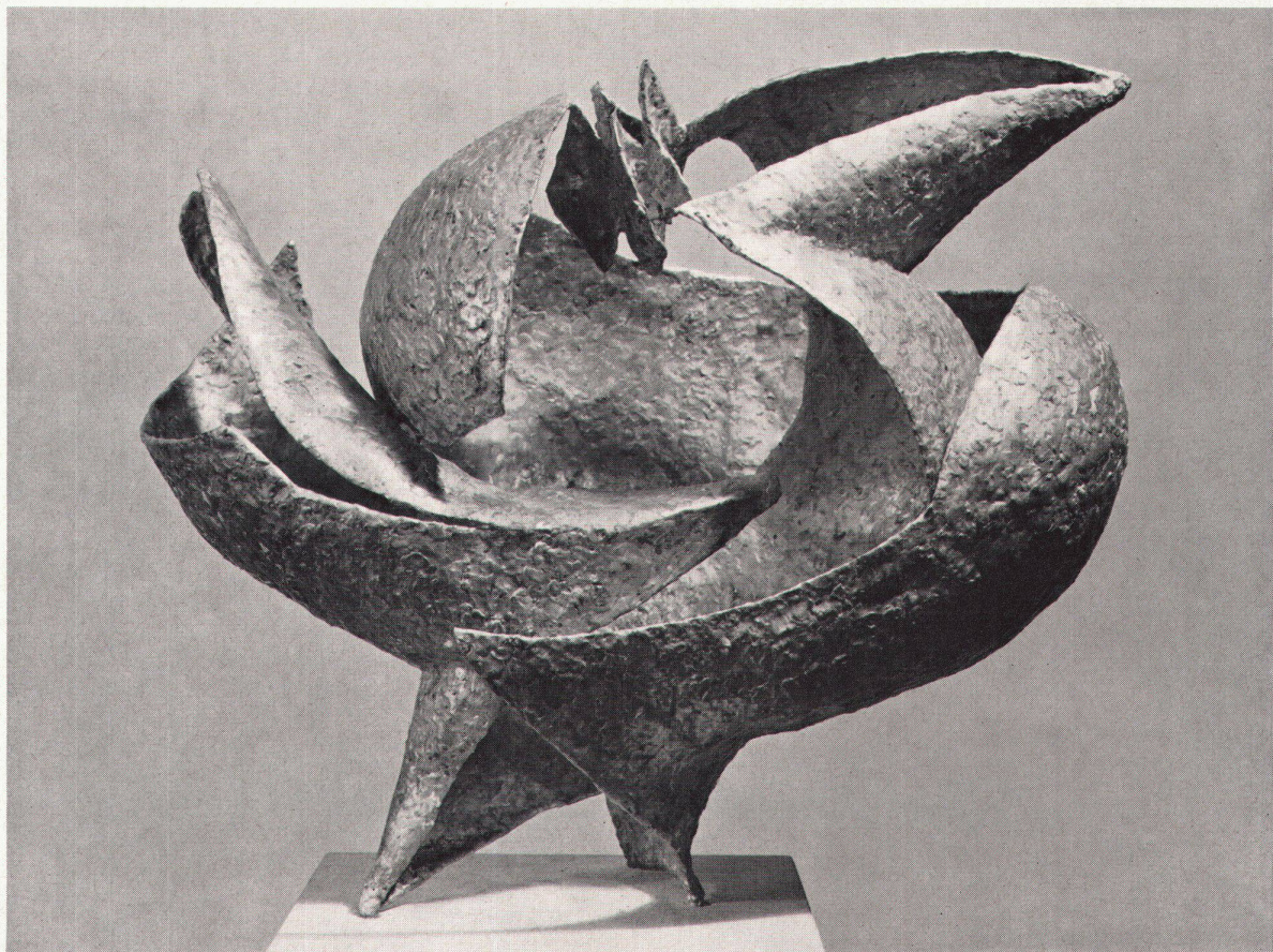
6 Herbert Ferber, Entwurf für ein Denkmal des unbekanntem politischen Gefangenen, 1952. Blei und Kupfer Maquette pour un monument au prisonnier politique inconnu. Plomb et cuivre Competition maquette for a Monument of the Unknown Political Prisoner Copper and lead Museum of Modern Art, New York