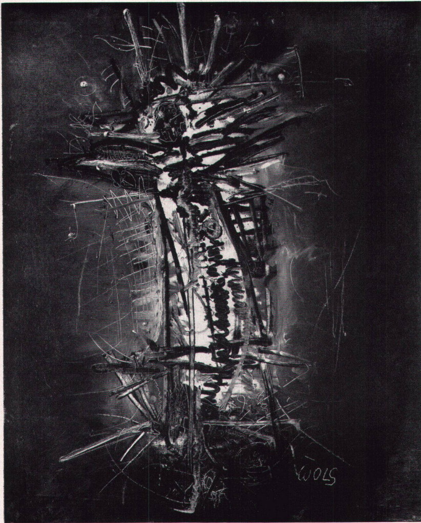
8 Wols, Letzte Komposition, 1951. Privatbesitz Paris Dernière Composition Last Composition

5. Die letzten Bilder kehren zur «Figur», zum Komplex (und dessen Absonderung vom Umraum) zurück. Ein farbig gesättigter Bildgrund, in der senkrechten Mittelachse eine aufgerissene Helligkeit, aber kein «Spalt» mehr, der an Wunden, an physische Verstümmelung gemahnt. Vielmehr ein farbiger Eklat, den die pinselführende Hand umgrenzt, eindämmt, bändigt, versperrt. Die Bildmittel sind reich gestaffelt: Kratzer, Schnörkel, dünner Zickzack, breite Farbsträhne, Flecken, deren Binnenform nadelfein aufgekrauselt wird, kurzlinige Farbspulen, die nach unten abrollen.