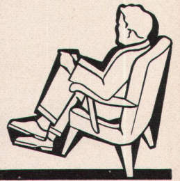
Klimaanlage «System Häusler» in Kinotheater

Walter Häusler & Co. Spezialfirma für Luftkonditionierung und Lüftung