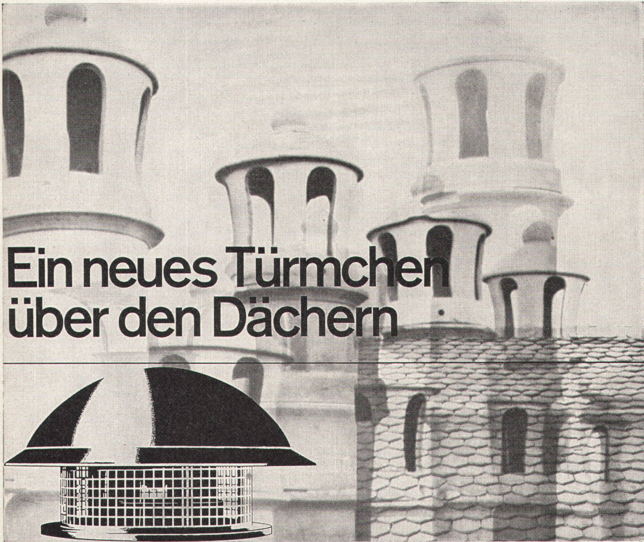
Der Dach-Luftabsauger MARELLI TR für Abluftschächte und -kanäle.

Wie schlecht ist oft die Luft unter den Dächern, gesättigt mit schlechten Gerüchen, mit Rauch, Staub und Dämpfen, verschmutzt und verdorben... und darin sollen wir atmen!