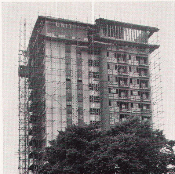
3 Wohnhaus in Kensal, London 1960 Immeuble locatif à Kensal, 1960 Flats at Kensal, London 1960