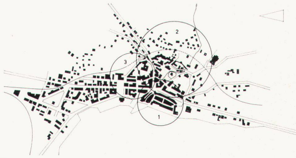
5 Plan der Innenstadt Plan du centre de la ville Plan of city centre