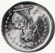
Bessere Masse ...