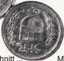
Mehr Gewinn ...