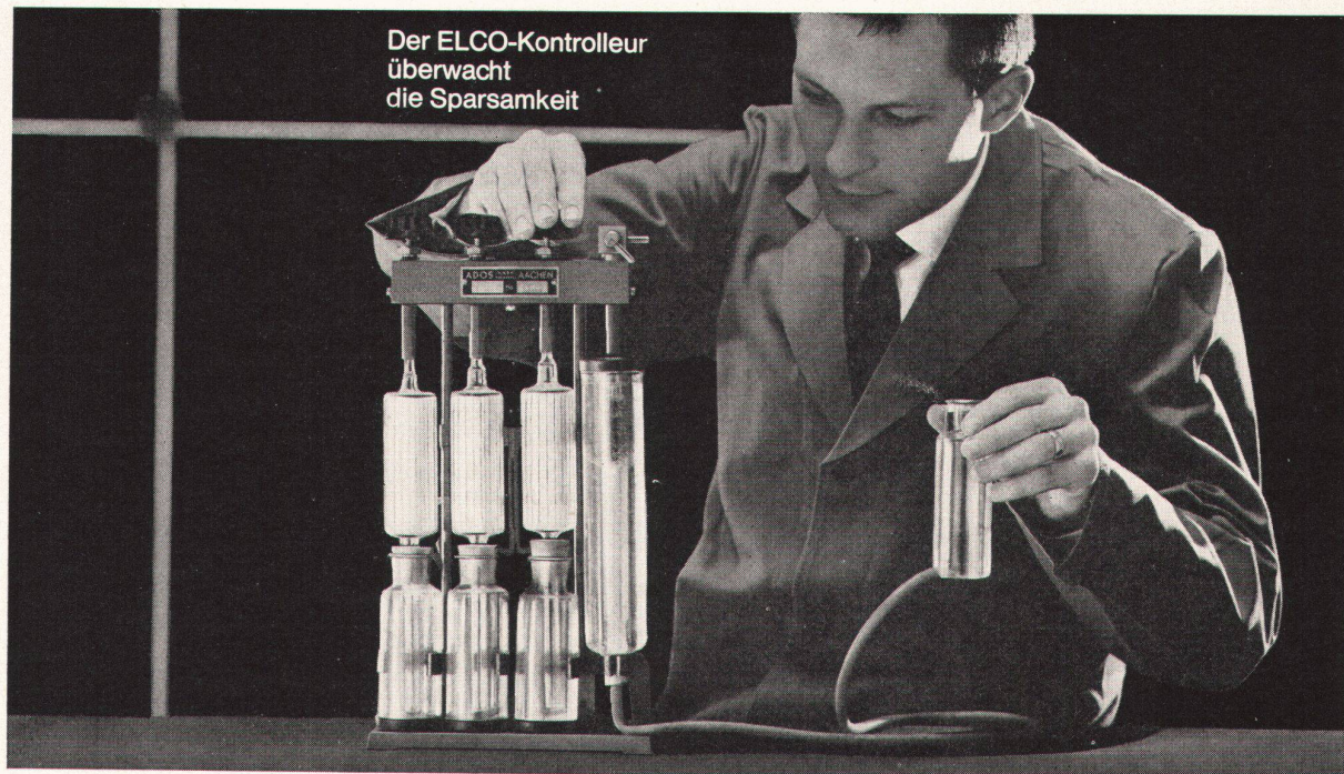
Der ELCO-Kontrolleur überwacht die Sparsamkeit

Bevor ein ELCO-Oelbrenner das Werk verlässt, wird er im Prüfstand einer exakten Schlusskontrolle unterzogen. Eine Phase daraus sehen Sie auf dem Bild! Die Rauchgas-Analyse mit dem CO 2 -Prüfgerät. Damit wird der ELCO-Brenner auf sparsamste Verbrennung einreguliert. — Die Schlusskontrolle gibt Ihnen und uns