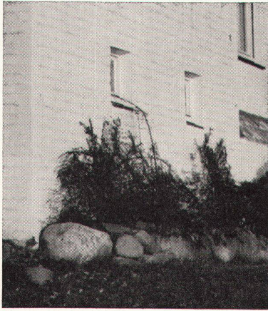
1 Cotoneaster horizontalis am Sockel eines Hauses