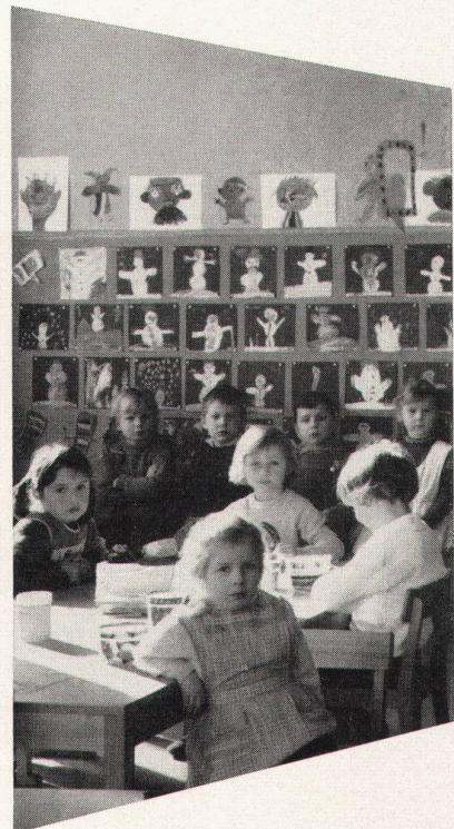
Mobiliar für Kindergärten

mit der 10-Jahres-Garantie für dauerhaften Schreibbelag und den Vorteilen: Angenehmes, weiches, blendungsfreies Schreiben und Zeichnen auf graugrün und schattenschwarzen, magnethaftenden und kratzfesten Flächen, die leicht zu reinigen sind.