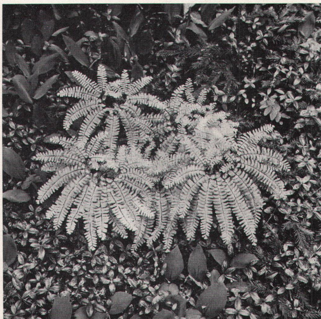
Haarfarn, Adiantum pedatum , über Immergrün, Vinca major und Maiglöckchen, Convallaria majalis

Anfang September wurde in Bern am Läuferplatz 6 eine neue Galerie eröffnet. Die erste Ausstellung ist dem 1918 in