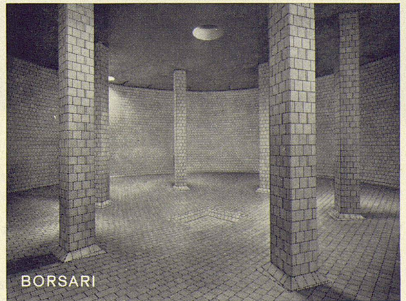
Flughafen-Immobilien-Gesellschaft Zürich-Kloten 7 Tanks total 5600 m 3 Schweröl

Direktion der Métallique SA, Postfach, 2501 Biel.