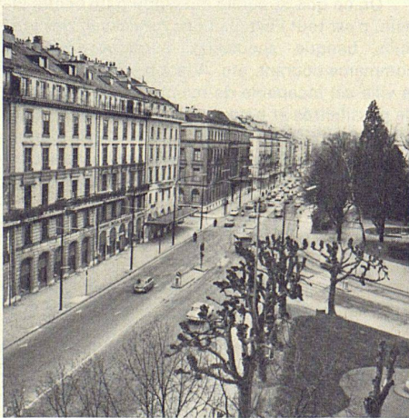
2 Quartier du Jardin anglais. Un parc, une grande artère de circulation rapide, une succession de blocs encore homogènes, bien que postérieurs à 1850

Naef: La configuration géographique ne suffit pas: il faut étudier soigneusement la topographie spécifique de Genève, la dimension des rues, leur tracé, la petitesse des parcelles. Voilà les données fondamentales.