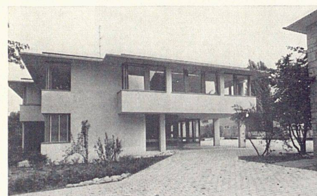
4 Pfarreiheim St. Michael, Basel. Architekt: Jost Trueb, Basel

Umgebung. Bauten gemeinsam mit Robert Winter BSA und Robert Ellenrieder BSA: Verwaltungsgebäude Interfrigo in Basel; Pflegerinnenschule Bürgerspital Basel (zusammen mit Leo Cron BSA); Quartierplanung Längi-Ost in Pratteln; Einfamilienhaussiedlung in Arlesheim; Erweiterungsbauten Bläsischulhaus in Basel; Schulhaus und Kindergärten in Pratteln; Pfarreiheim St. Michael in Basel; Einfamilienhäuser in Baselland; Projekte für Schulzentrum und Wohnbauten in Riehen.