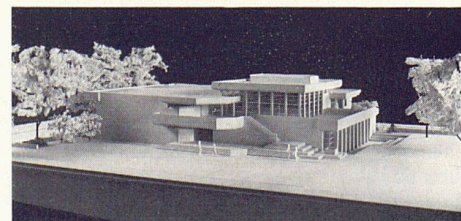
5 Projekt für die Erweiterungsbauten des Bläsischulhauses, Basel. Architekt: Robert Winter, Basel

Bauten gemeinsam mit Jost Trueb BSA: Umbau des Modehauses zum Wilden Mann in Basel; Einfamilien- und Miethäuser in Basel und Umgebung. Bauten gemeinsam mit Jost Trueb BSA und Robert Ellenrieder BSA: Verwaltungsgebäude Interfrigo in Basel; Pflegerinnenschule Bürgerspital Basel (zusammen mit Leo Cron BSA); Quartierplanung Längi-Ost in Pratteln; Einfamilienhaussiedlung in Arlesheim; Erweiterungsbauten Bläsischulhaus in Basel; Schulhaus und Kindergärten in Pratteln; Pfarreiheim St. Michael in Basel; Einfamilienhäuser in Baselland; Projekte für Schulzentrum und Wohnbauten in Riehen.