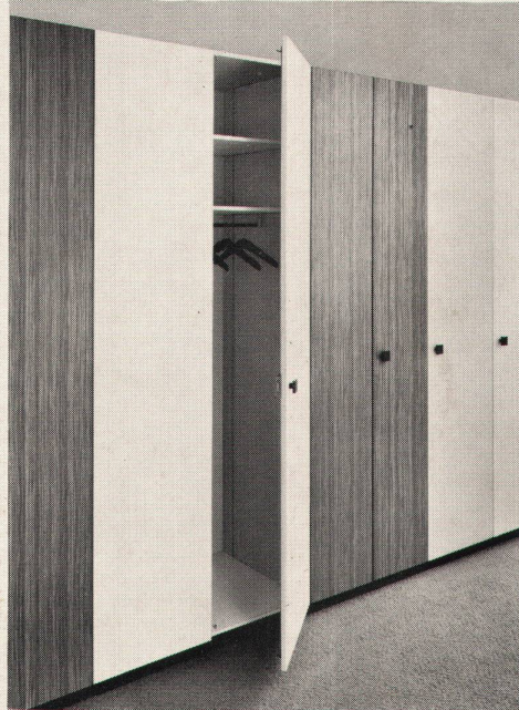
Das sind Wernle-Einbauschränke. Zum Beispiel.

Bitte ausfüllen und einsenden an: J. Wernle AG, Kirchbergstrasse 1030, 5024 Küttigen/Aarau. Danke.