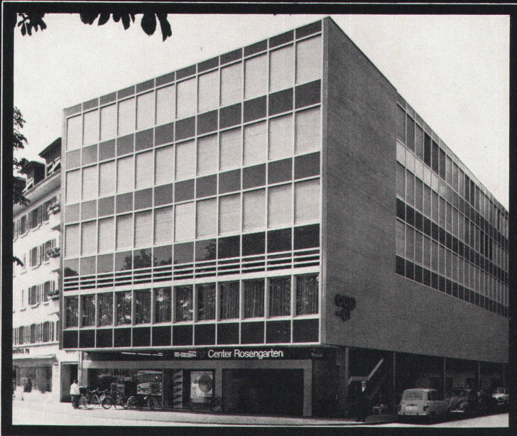
Geschäftshaus-Center Rosengarten, Solothurn. Aluminium-Fassaden mit Modell HZ 750 und vollisolierten ALSEC-50-Fenstern.

E. Hauer's Erben, Zürich Geschäftshaus mit vollisolierten ALSEC-50-Fenster Isolierplatten-Brüstungen mit vor- gehängten Silafont-Gussplatten.