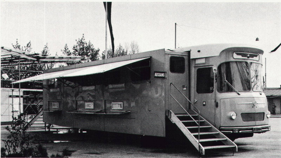
4 Automobilpostbüro mit 4 Kundenschalern. 5 Der Biblio-Bus.