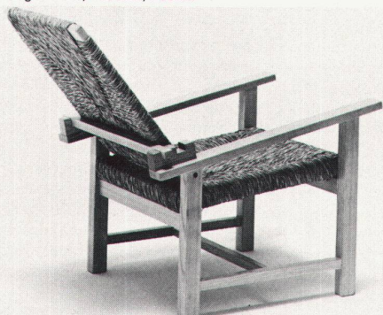
Design: Lomazzi, De Pas, D'Urbino