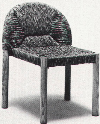
Design: Pajetta, Chiozzi