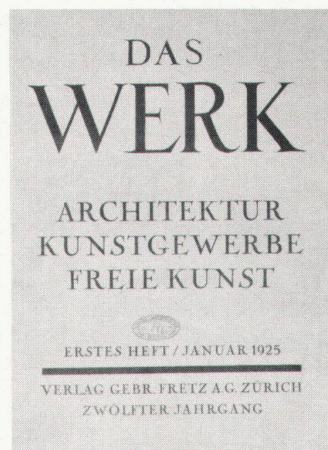
Numéro de janvier 1925 Januarheft 1925

punkt der «alten Garde». Letztere will die Rechtmässigkeit ihres korporativen Vorrangs untermauern. Vielleicht handelt es sich um eine Selbstverteidigung gegen den Einbruch in das Gebiet der Berufsaus-