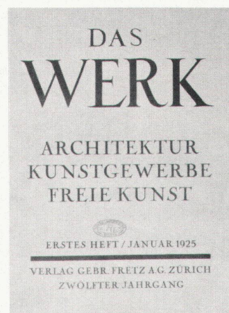
Numéro de janvier 1925 Januarheft 1925

punkt der «alten Garde». Letztere will die Rechtmässigkeit ihres korporativen Vorrangs untermauern. Vielleicht handelt es sich um eine Selbstverteidigung gegen den Einbruch in das Gebiet der Berufsaus-