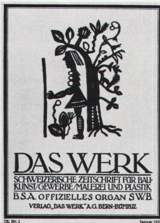
Numéro de janvier 1922 Januarheft 1922

Les options illustrées en 1914 – «qualité» de l'«œuvre totale»; accord avec la «Nouvelle Tradition» nationale –, sans cesse réaffirmées durant '14-'18, allaient porter Das Werk à nier l'existence même des bouleversements, de la mise en question, et finalement de la rupture, entraînés par la Grande Guerre. La revue entendait produire des preuves, non des interrogations ou des hypothèses. On sait que la première guerre mondiale avive ou suscite différents mouvements d'«avant-garde»: confirmation du futurisme