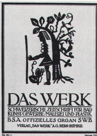
Numéro de janvier 1922 Januarheft 1922

Les options illustrées en 1914 – «qualité» de l'«œuvre totale»; accord avec la «Nouvelle Tradition» nationale –, sans cesse réaffirmées durant '14-'18, allaient porter Das Werk à nier l'existence même des bouleversements, de la mise en question, et finalement de la rupture, entraînés par la Grande Guerre. La revue entendait produire des preuves, non des interrogations ou des hypothèses. On sait que la première guerre mondiale avive ou suscite différents mouvements d'«avant-garde»: confirmation du futurisme