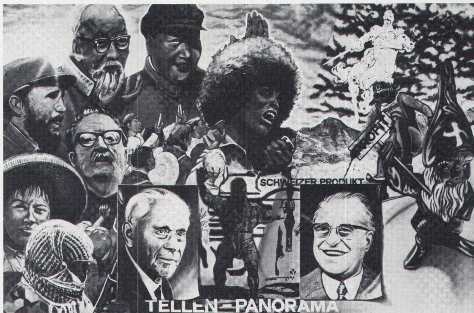
Hugo Schuhmacher, «Völker wollen Freiheit», 1972, 200 x 320 cm, Acryl auf Baumwolltuch

1) Um die Überlegenheit der neuen Medien in bezug auf «Wirklichkeitsgestaltung» gegenüber den traditionellen «bildenden Künsten» als Halbwahrheit zu enthüllen, müsste man hier eine Strukturanalyse der verschiedenen Gestaltungsmedien folgen lassen. Ein schwieriges Unterfangen, das der Kommunikations-theorie nicht entraten könnte. Die Verschleifung der Grenzen von Abbildung und Abgebildetem, zu welcher der «naive» Betrachter (wer ist hier ganz frei von