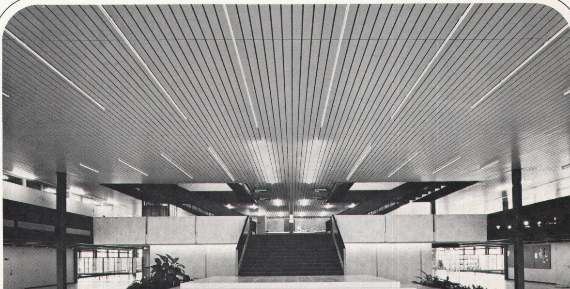
Technikum Rapperswil LUXALON ® -Paneeldecke Typ 134 H