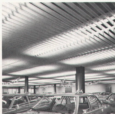
Eulach-Garage Winterthur, LUXALON ® -Rasterdecke Typ 100 V