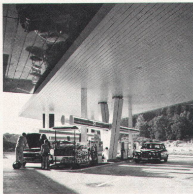
Autobahn-Tankstelle Würenlos LUXALON ® -Fassadenverkleidung Typ 150 F (als Decke montiert)

Besser gesagt, weil LUXALON ® -Aluminiumdecken nur Vorteile bieten: