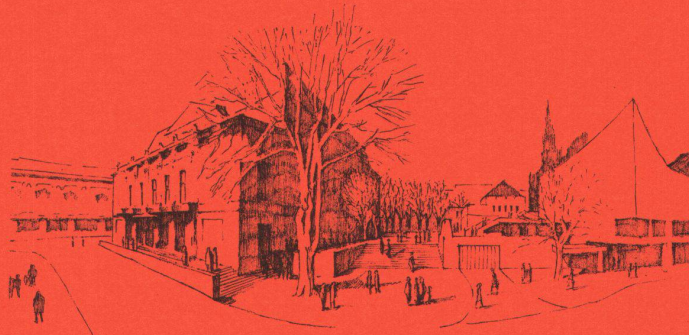
1 Altes und neues Theater in Basel mit dem neugestalteten Theaterplatz. Perspektivische Skizze zum Vorschlag Planteam SWB.

prägen und eben deshalb den Bewohnern besonders vertraut sind. Die Umbauvorschläge zeigen, dass das alte Theater je nach Umbaugrad verschiedensten Nutzungen zugeführt werden könnte. Untersucht und als möglich erachtet wurden vom Planteam sowohl rein kommerzielle als auch einheitlich der Öffentlichkeit dienende Nutzungsarten. Bei den letzteren wäre abzuklären, inwieweit die bestehenden kulturellen Einrichtungen im Zentrum (neues Theater, Musikäle, Kunsthalle und Museen) ergänzt und somit als Kongress- und Kulturzentrum intensiviert werden könnten.