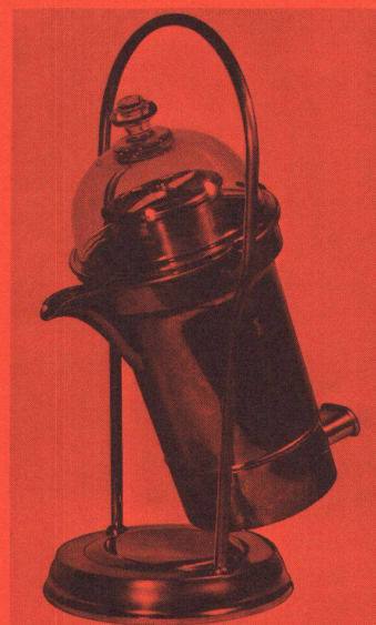
Cafetière électrique AEG, 1910-1920