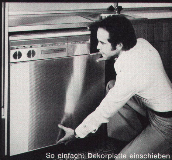
So einfach: Dekorplatte einschieben