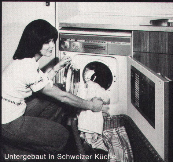
Untergebaut in Schweizer Küche