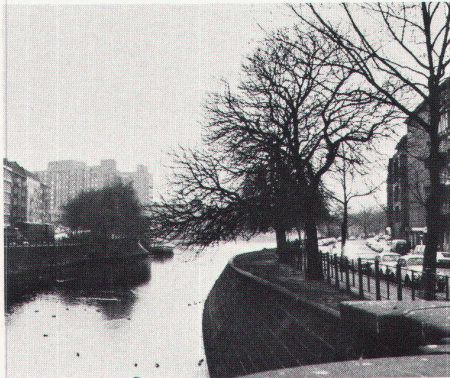
Topographie. Natürliche Grenze: Uferpanorama am Fraenkelufer

Jeder, der heute die mühevollen Wiederbelebnungsversuche historisch bedeutsamer Stadtbereiche verfolgt, kennt diese Zweifel, die über die zerstörerischen Eingriffe der Verkehrsplanung und des Stadtspekulantentums hinaus die Tragfähigkeit einer geschichtlichen Idee im Städtebau berühren und in dem pro domo der