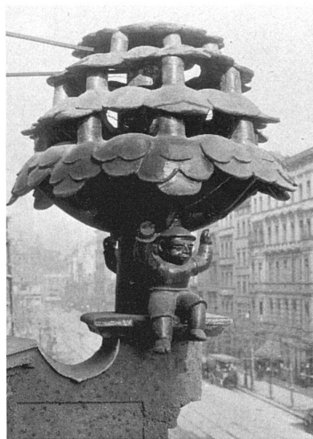
P. R. Henning, Fassadenskulptur an O. R. Salvisbergs Lindenhof, Berlin (1912-13).