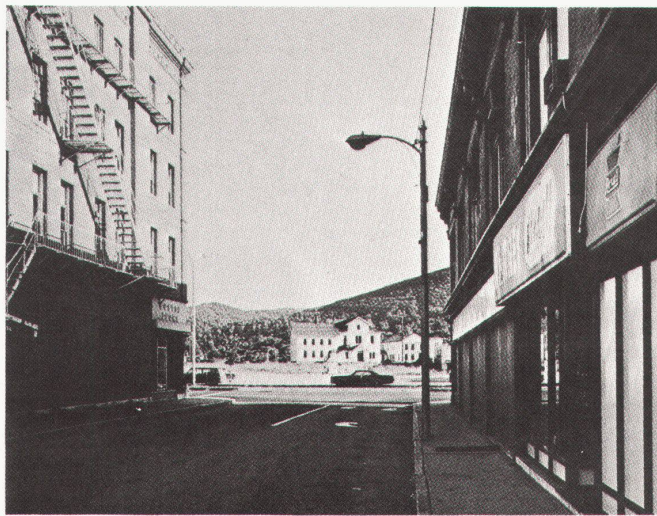
Stephen Shore, 1947. No Title, 1976

Farbfotografen vertreten mit ihren Porträts, Stilleben und Landschaftsbildern das Postulat der «Wahrheitstreue». Ganz besonders kommt dies in ihren Zyklen aus dem modernen Grossstadtleben zum Ausdruck, in denen die Zivilisation eine kühle künstlerische Gestalt gewinnt.