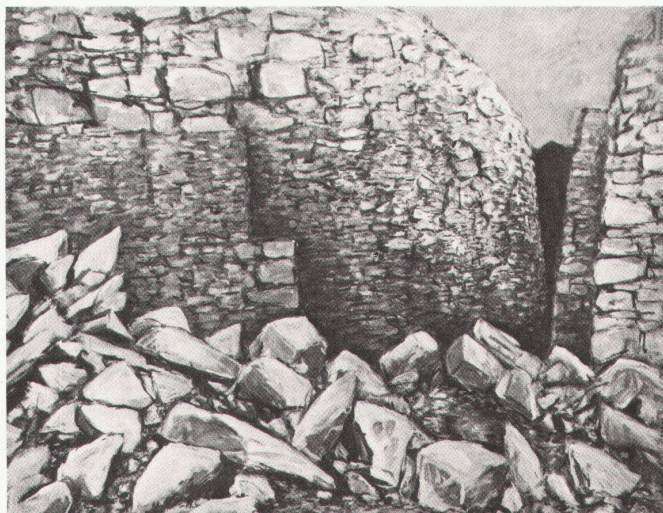
1 gen missbraucht wurden.»

Im grossen, hohen, luftigen deutschen Pavillon ist quantitativ wenig zu sehen. Im kleinen, niedrigen schweizerischen viel.