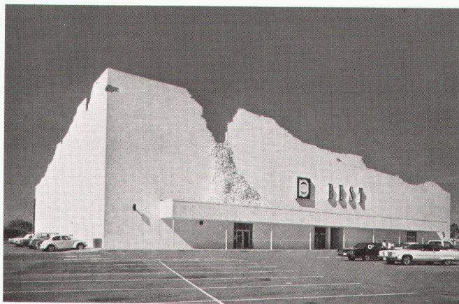
Kaufhaus Houston/Texas 1974/75

Dr. Charles Jencks, geboren 1939, ist Professor für Geschichte der Gegenwartsarchitektur an der Architectural Association in London und an der University of California in Los Angeles sowie Verfasser zahlreicher Publikationen über Tendenzen der modernen Architektur.