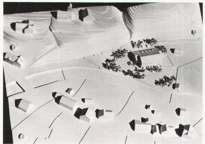
1. Preis, Turnhalle Stein/Toggenburg