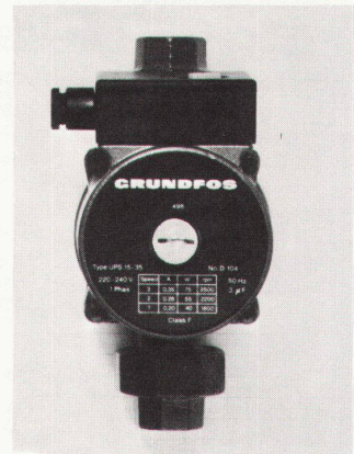
2 Kleinumwälzpumpe Grundfos UPS 15

Der speziell für diese Pumpe von Grundfos entwickelte und gebaute Spaltrahmotor ist blockierungsfest. Ein Schutzschalter ist dafür nur erforderlich, wenn vom EW vorgeschrieben. Das besonders hohe Anlaufmoment des Motors sichert in jeder Drehzahl einen störungsfreien Betrieb der Pumpe. Die Funkenstörung entspricht dem Funkenstörungsgrad N. Eine verbesserte Klemmverbindung erleichtert den Anschluss an das Stromnetz.