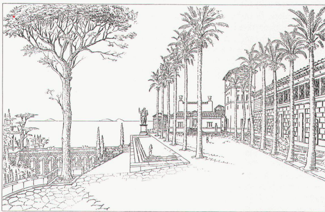
Léon Krier, projet pour la villa de Pline, 1982

Date: du 25 mai au 19 juin 1982. Lieu de présentation: Institut Français d'Architecture, 6, rue de Tournon, 75006 Paris, Ancienne Galerie. Jours et heures d'ouverture: du mardi au samedi, de 12 h 30 à 19 h, entrée libre; visite-conférence: tous les mardis, jeudis et samedis à 17 h 30.