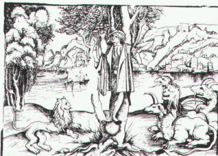
Holzchnitt zu Niclaus Moler, 1507

Universitätsbibliothek Basel Basler Buchillustration 1500–1545 bis 30.6.