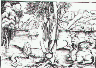
Holzchnitt zu Niclaus Moler, 1507

Universitätsbibliothek Basel Basler Buchillustration 1500–1545 bis 30.6.