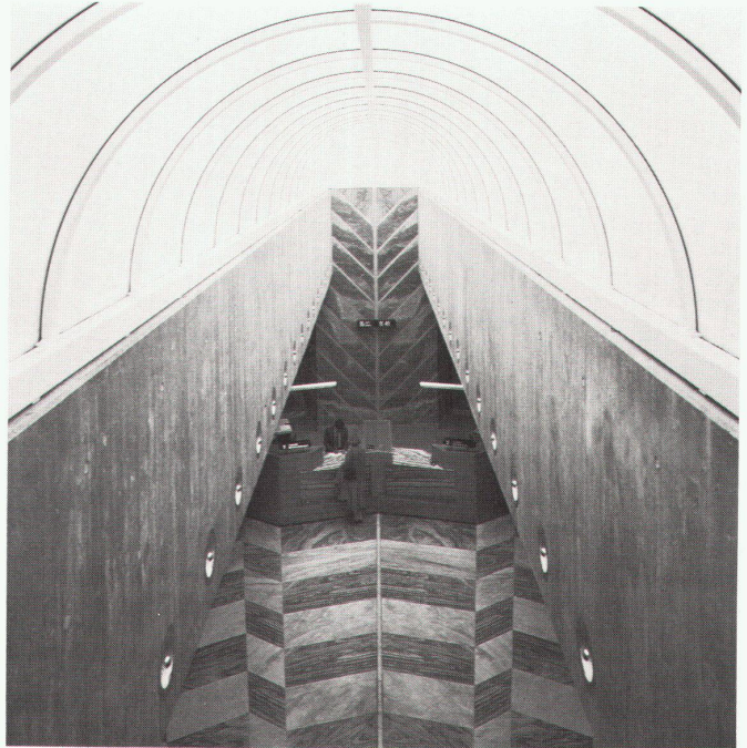
Mario Botta: Banque L'Etat à Fribourg