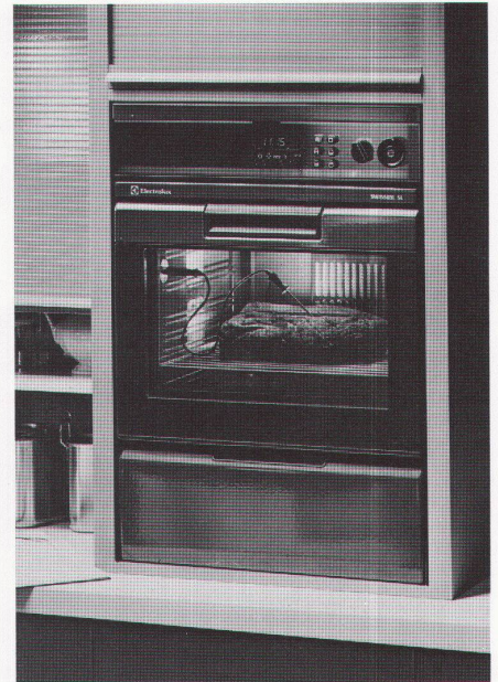
Einbaubackofen SL 6