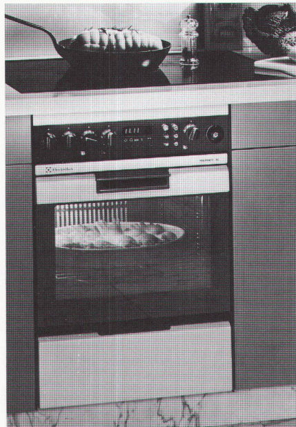
Einbaugerät SL 6

verhindert, dass es in der ganzen Wohnung nach Essen riecht und hält die angrenzenden Möbel kühl. Jetzt können Sie die umliegenden Tablare bedenkenlos für die Aufbewahrung von Lebensmitteln benutzen.