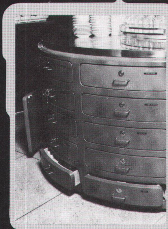
▲ Beispiel: Buffet-Anlage