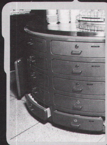
▲ Beispiel: Buffet-Anlage