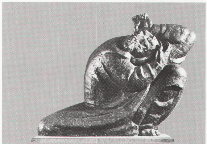
Ivan Meštrović, Hiob, 1932

Netsuke – Japanische Kleinplastik bis 3.5.