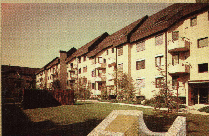
Atelier René Villiger ASC, Sins