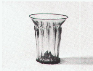
Rippenbecher aus farblosem Glas mit blauem Randfaden, 13. und frühes 14. Jahrhundert

Phönix aus Sand und Asche – Glas des Mittelalters 21.4.–24.7.