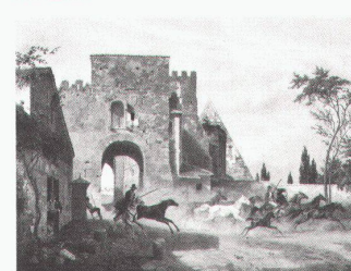
Ludwig Max Prätorius: Die Porta S. Paolo und die Cestiuspyramide in Rom, 1847

Ludwig Max Prätorius – Reisen nach Rom 1844–1856 bis 15.5.