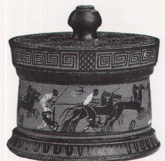
Attische Pyxis mit schwarzen Figuren

Le Corps et l'esprit – Trésors de la Grèce antique bis 15.7.