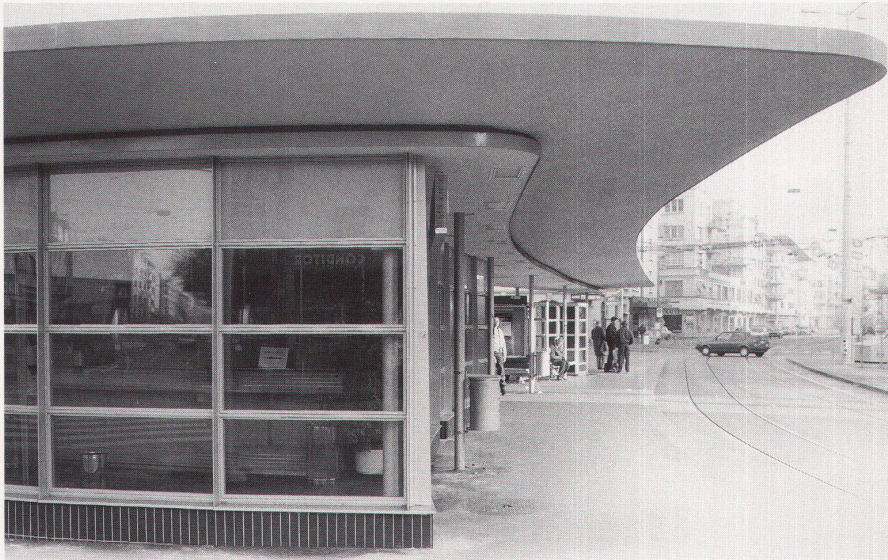
3 Ansicht von Westen / Vue de l'ouest / View from the west