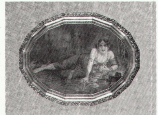
Dortmund, Salome, Farbdruck der Kunst- anstalt Wandsbek bei Hamburg, um 1925

Jeanne Mammen. Gemälde, Aqua- relle und Grafiken der Berliner Rea- listin bis 23.6.